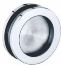
Maner usa glisanta: